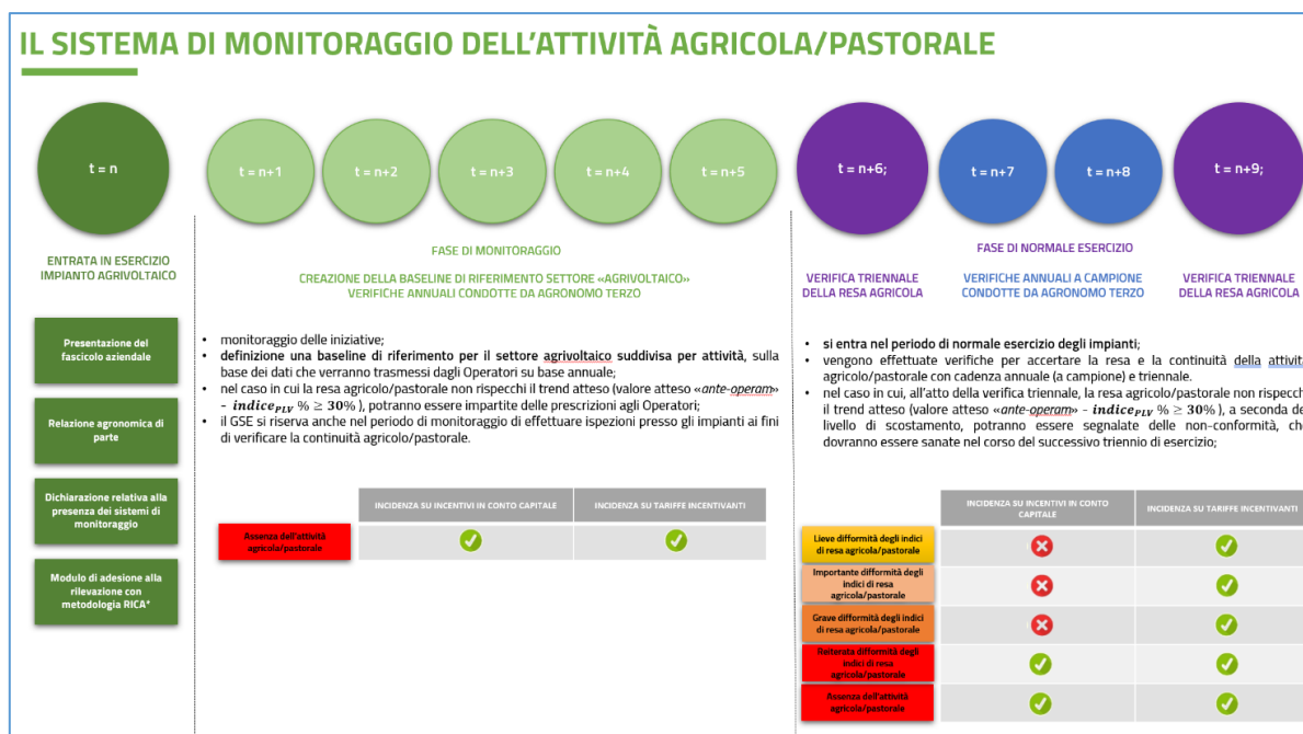
Figura 1 - Il sistema di monitoraggio dell'attività agricola/pastorale