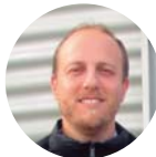
PROCORO DEL REAL Architetto Ras Arquitectos Solution SL, Elche, ALICANTE