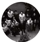
STEFANO BOERI ARCHITETTI MILANO