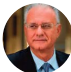
On. GIANLUCA SUSTA Senatore XVII Legislatura della Repubblica Italiana