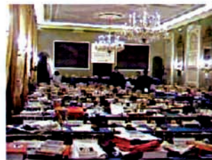
Il Seminario Ambrosetti di Cernobbio