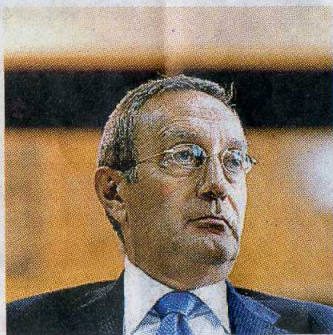
Governo Antonio Catricalà

verno stesso. «A nostro parere il Dpr presenta evidenti e ben precisi profili di illegittimità — spiega Roberto Orlandi, capogruppo delle Libere professioni all'interno del Cnel —. Il testo viola la riserva di legge assoluta sulla composizione del Cnel: l'organismo, infatti, deve essere determinato esclusivamente per legge e in nessun altro modo. Inoltre fa decadere un organismo costituzionale in carica: il Cnel è previsto dall'articolo 99 della Costituzione, senza alcuna motivazione plausibile, il che rappresenta un fatto inaudito,