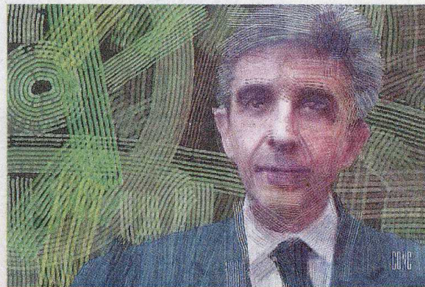
Leader Roberto Orlandi, presidente del Consiglio nazionale degli agrotecnici. In preparazione il «Restitution day» dei contributi

gono più redditizie, a volte prendendosi anche dei rischi. La nostra proposta è stata quella di poter utilizzare il 50% dei ricavi degli investimenti per arricchire le pensioni dei nostri assistiti. In un primo momento ci è stato risposto che questo avrebbe creato una concorrenza tra Casse e una potenziale disparità tra sistemi previdenziali, ma la sentenza del Consiglio di Stato ci ha dato totalmente ragione».